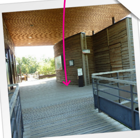
Votre point de rendez-vous