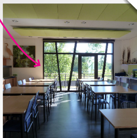
La salle pédagogique